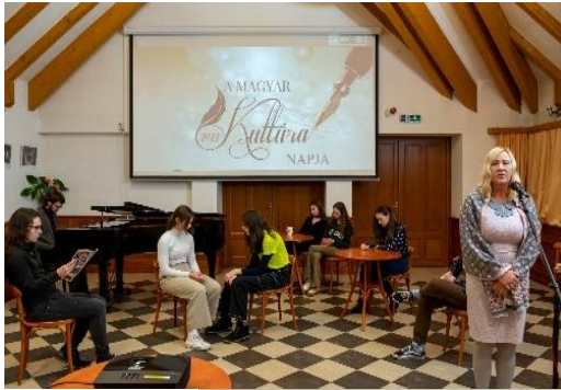
(6. sz. melléklet: Rendezvényeink pillanatképei 2023.)